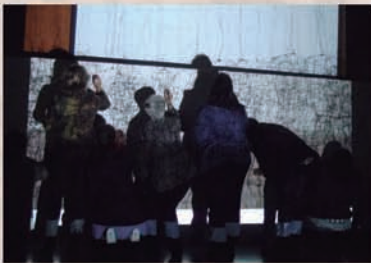
Impartido por: Cristina Gozzini

La fugacidad de las sombras se asocian con el sentido de impermanencia, como regla de vida. Las conexiones entre luz y sombra, vacío y lleno, son las oscilaciones y alternancias del vivir cotidiano hecho de memorias, emociones, sentimientos, vivencias que nos acercan o nos alejan del ser que somos.